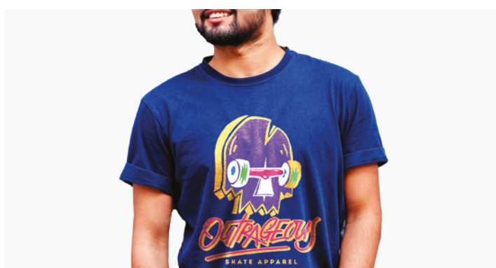
TRANSFERENCIA TÉRMICA TEXTIL